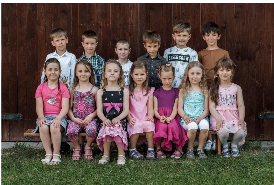
Předškoláci, MŠ Záchlumí