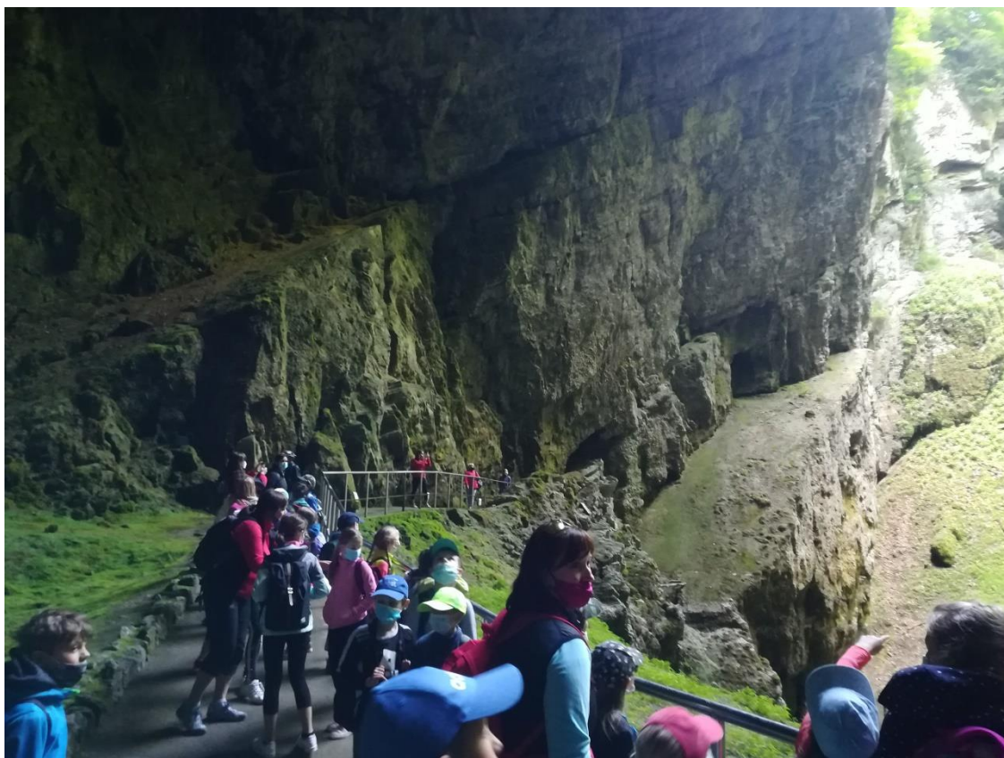
Školní výlet – Propast Macocha – červen 2021.