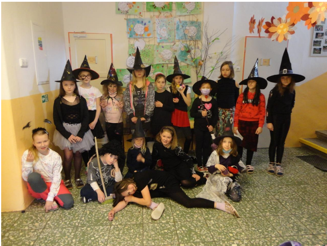
Čarodějnické hry ve škole.