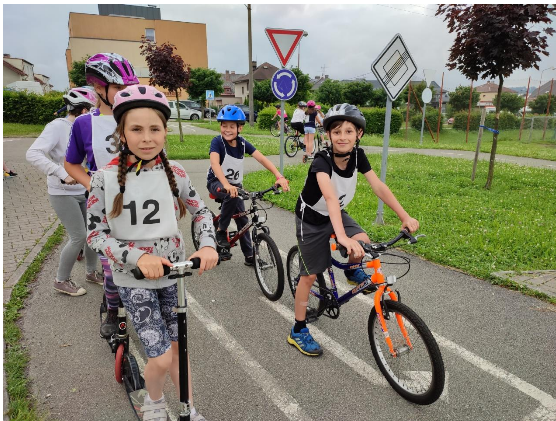
Dopravní hřiště v Žamberku – dopravní výchova.