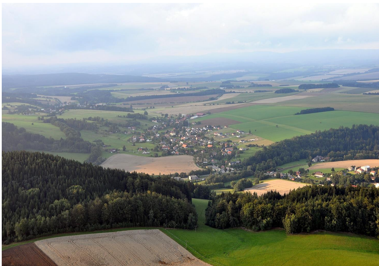
Obec Záchlumí, archiv obce