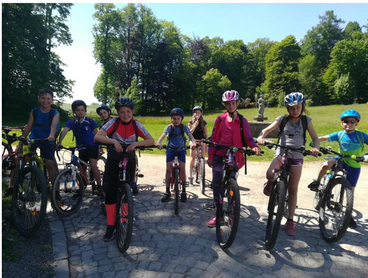
Cyklistický výlet do Letohradu – červen 2021.