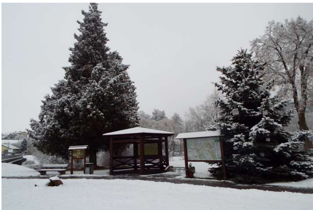
Vánoční strom před Fontánou