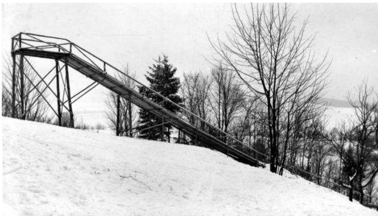
sokolský lyžařský můstek v Záchlumí