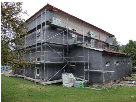
v průběhu rekonstrukce

O prázdninách proběhla výměna oken, výměna zadních dveří, zateplení celého pláště budovy, zateplení půdy, jak ve škole, tak i nad sociálním zařízením. Při této akci proběhla i celková obnova sociálního zařízení, včetně odpadů, které se při poslední rekonstrukci nedělaly. Byly provedeny nové rozvody vody a odpadů do tříd. Provedlo se nové odvedení dešťové vody, nátěr okapů a okraje střechy. Celkový náklad zateplení je zhruba 1,5 mil. Kč. Dotace