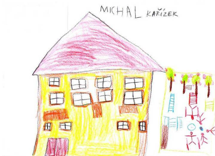
Michal Kařízek, 1. roč.