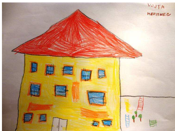
Vojtěch Martinec, 1. roč.