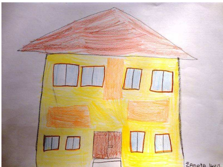
Žaneta Jirčíková, 2. roč.

O prázdninách nám změnili školu. Předělali okna, staré záchody za moderní. Dali nám na záchody nové kachličky a zrcadla. Moc se mi líbí, jak je škola barevně namalovaná. Naše škola je teď krásně vidět.