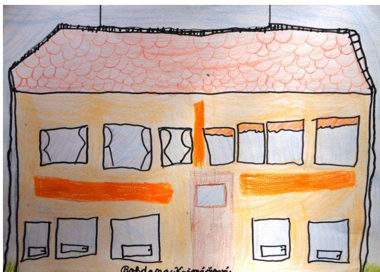
Bohdana Krčmářová, 2. roč.