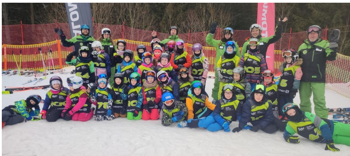
třídenní příměstský lyžařský výcvik na Dolní Moravě – leden 2026

Mezi tradiční a atraktivní školní akce na konce 1. pololetí patřil příměstský třídenní lyžařský výcvikový kurz, který děti absolvovaly na Dolní Moravě od 26. do 28. ledna. Děti byly rozděleny do skupin po 6 – 7 a měli je na starosti zkušení lyžařští instruktoři z lyžařské školy Amálka. Začátečníci a menší děti zkusili své první obloučky a dovednosti na dětském pásovém vleku a Tatrapomě. Ti starší a zkušenější již od začátku využívali velkou sedačkovou lanovku, zdokonalovali oblouk z pluhu, dlouhý, krátký oblouk, lyžařskou techniku a další dovednosti. Vždy v polovině výcvikového dne byl pro děti připraven oběd v horské chatě Marcelka, která se nachází na dolní stanici lanovky. Všichni účastníci si moc pochutnali. Po obědě se někteří žáci v průběhu výcviku přesunuli z dětských vleků na sedačkovou lanovku a zkusili si sjíždět velkou a náročnější sjezdovku. Třídenní výcvik měl opravdu pozitivní vliv na rozvoj dovedností u dětí a všichni se naučili lyžovat anebo se zdokonalili. Na závěr kurzu se uskutečnily dovednostní jízdy, kde všichni podali skvělé výkony a ukázali, co se za tři dny lyžování naučili. Po zásluze pak byli odměněni drobnými cenami. Tento zimní lyžařský výcvikový kurz se všem moc líbil a měl pozitivní ohlas.