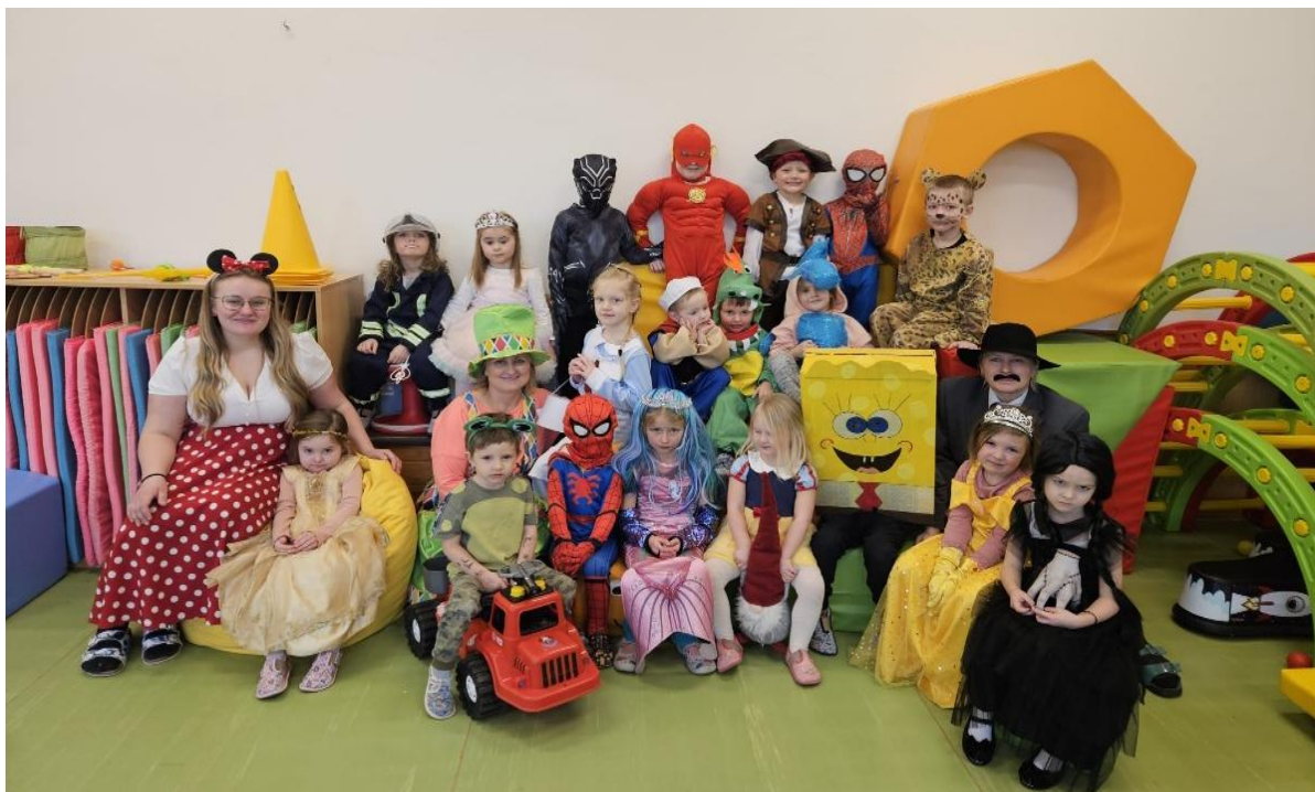
Foto MŠ Záchlumí, maškarní karneval