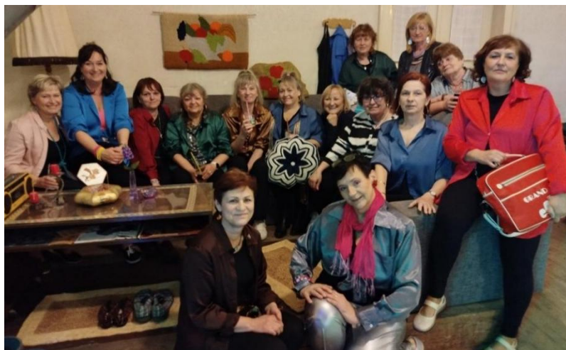
Retro party