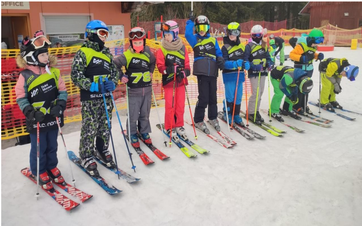
Foto ZŠ Bohousová, třídní příměstský lyžařský výcvik na Dolní Moravě – leden 2026