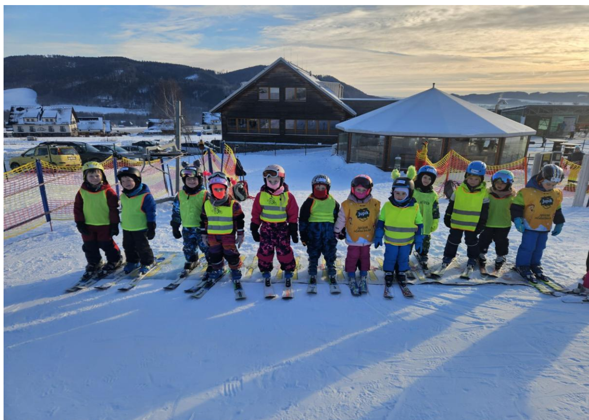
lyžařský výcvik na Bukové Hoře