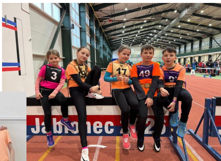
závody v Jablonci nad Nisou