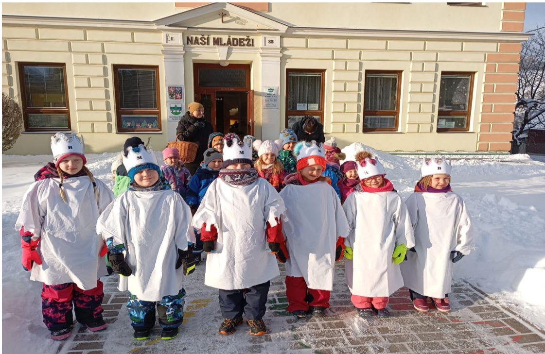
Tříkrálová sbírka